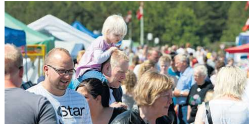
Lemvig Marked og Dyrskue afvikles under mottoet "Oplevelser for alle", og det plejer at tiltrække mellem 10.000 og 12.000 besøgende.

Og netop overskriften "Oplevelser for alle" er i høj grad