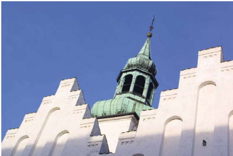
De lokale kirker er for første gang med på Lemvig Marked og Dyrskue. Arkivfoto.